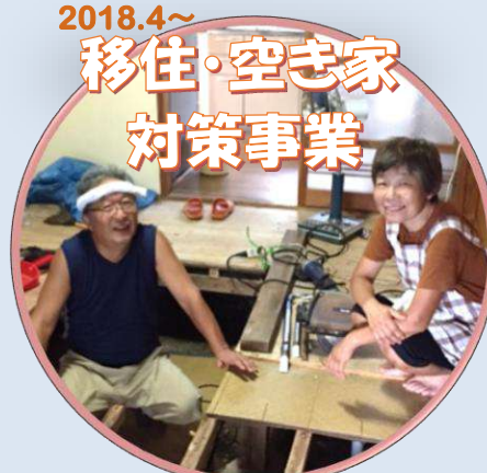
2018.4～ 移住・空き家 対策事業