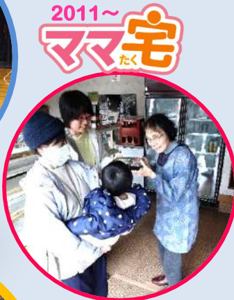
2011～ ママ宅 たく