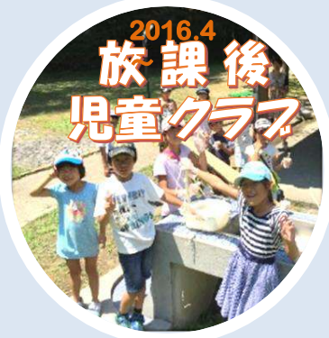
2016.4 放課後 児童クラブ