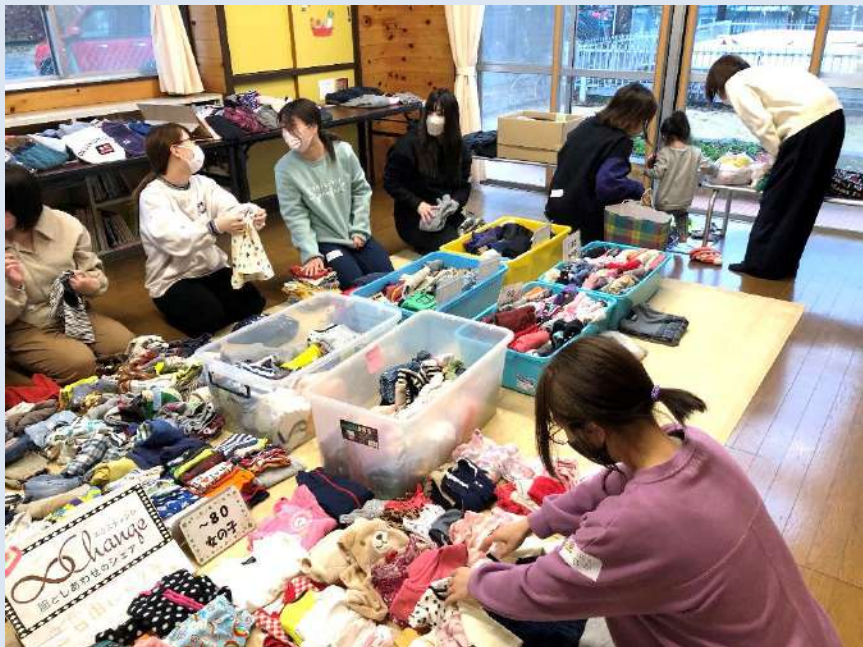
2023エクステンジの様子