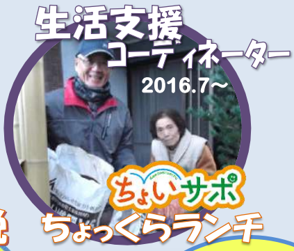
生活支援 コーディネーター 2016.7～