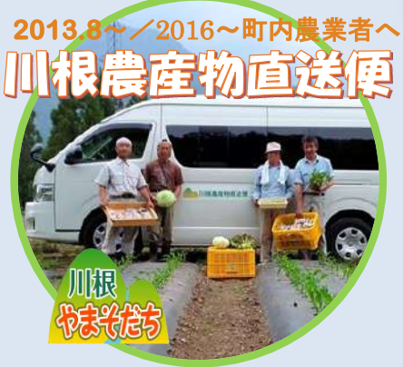
2013.8～/2016～町内農業者へ 川根農産物直送便