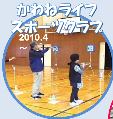
かわねライフ スポーツクラブ 2010.4～