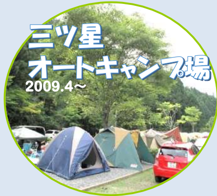
三ツ星 オートキャンプ場 2009.4～