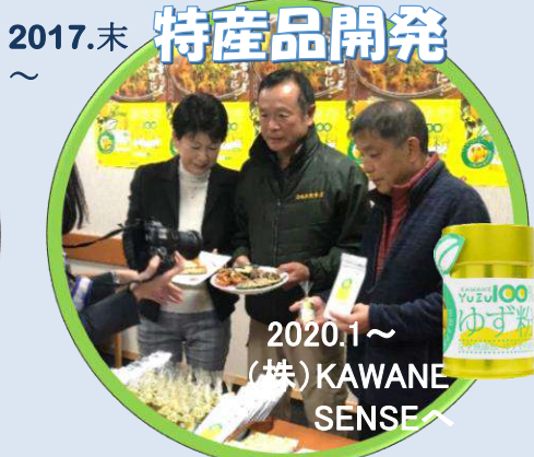
2017.末 特産品開発 ～