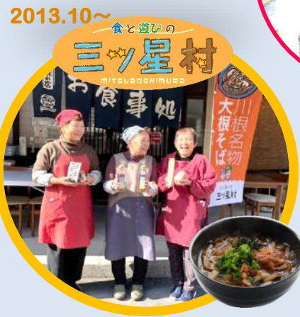
2013.10～ 食と遊びの 三ツ星村 MITSUBISHI VILLAGE 食事処 大根名物 川根そば 三ツ星村