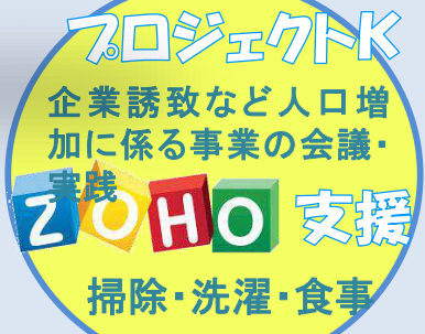
プロジェクトK 企業誘致など人口増加に係る事業の会議・実践 ZOHO 支援 掃除・洗濯・食事