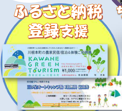
ふるさと納税 登録支援