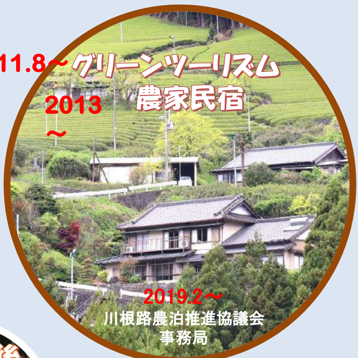
2011.8～ グリーンツーリズム 2013～ 農家民宿 ～