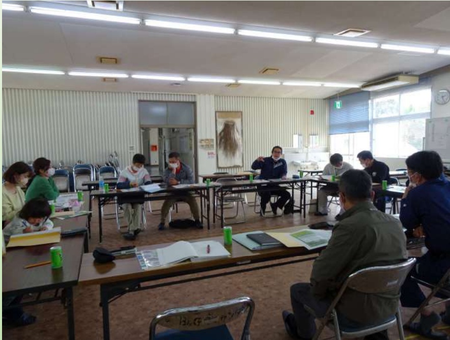
会員による活動内容の協議