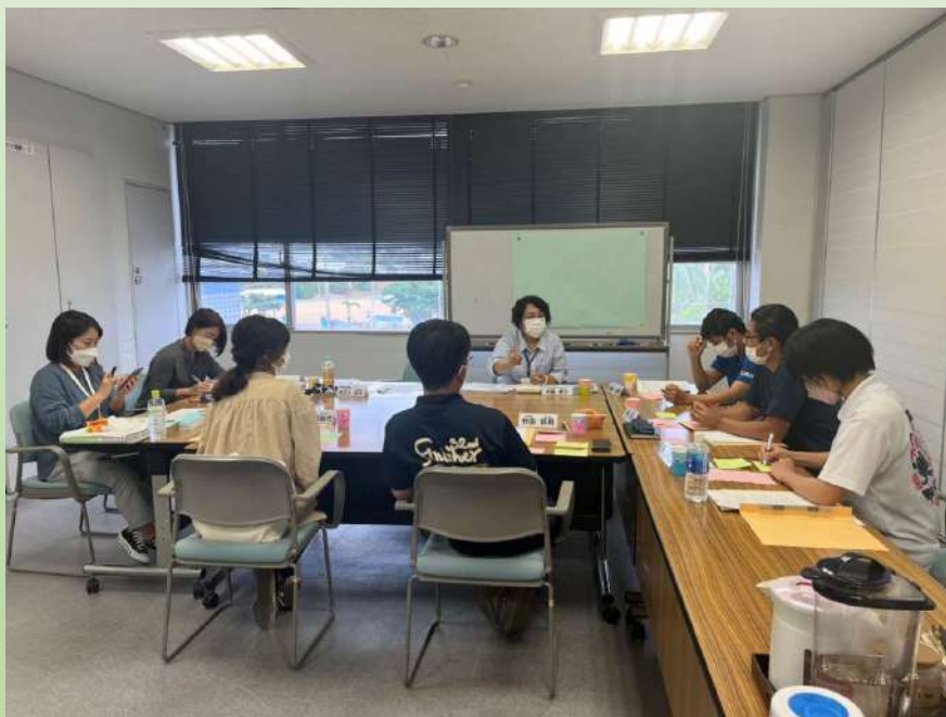
合意形成手法の習得