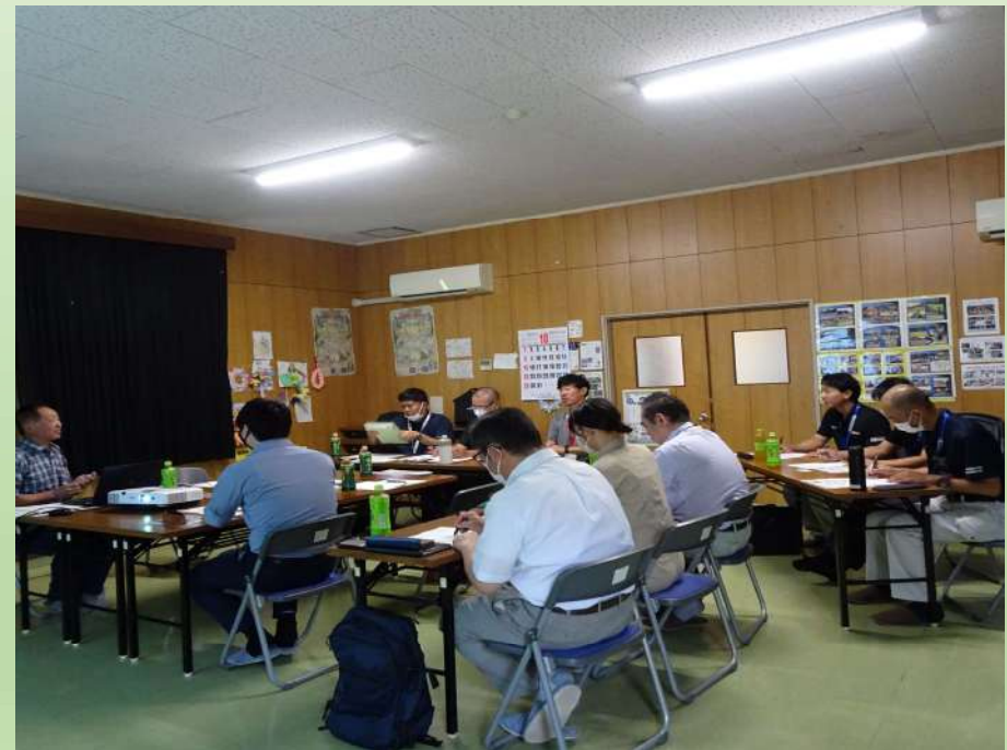
アンケート結果の検討